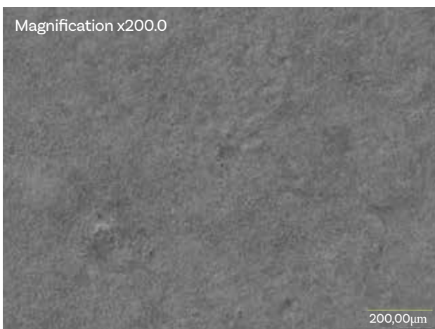
Digital Optical Microscopy image: compact surface with natural effect.

🇬🇧 Morphological Texture 🇪🇸 Morfología Superficial