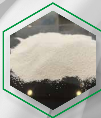
"READY TO USE" CALIBRATED PRODUCT