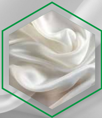
SILKY SMOOTH SURFACE WITH PLEASANT TOUCH

🇪🇸 Sicer presenta un acabado cerámico exclusivo con características inigualables. Una fórmula personalizable y adaptada en función de la necesidad de cada cliente.