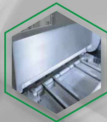
SUITABLE FOR AIRLESS AND NEW APPLICATION TECHNOLOGIES