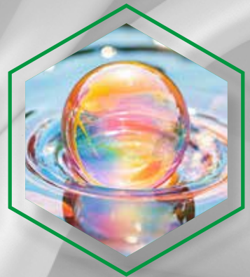
EXTREME TRANSPARENCY AND GREAT COLOR DEVELOPMENT